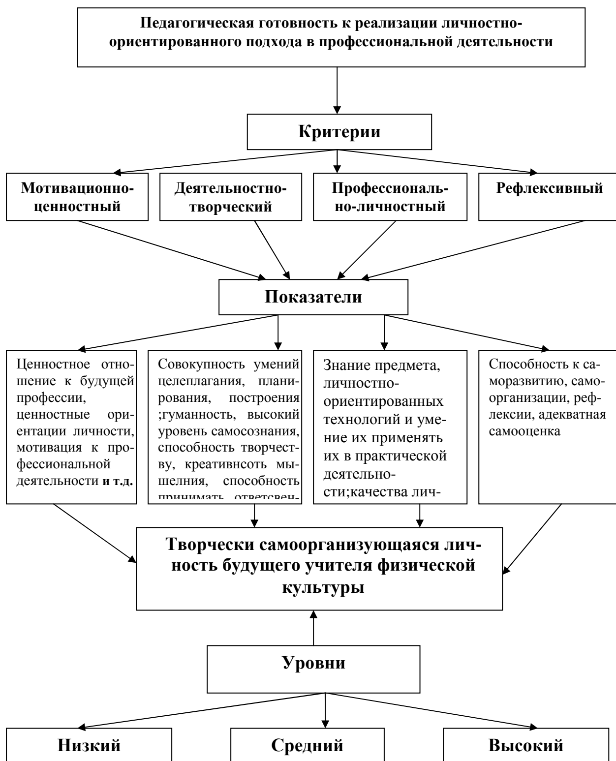
Схема 1. Структура педагогической готовности студентов к реализации личностно-ориентированного подхода в профессиональной деятельности.

технологии в учебно-воспитательный процесс по подготовке учителя физической культуры. (Г.К. Селевко)